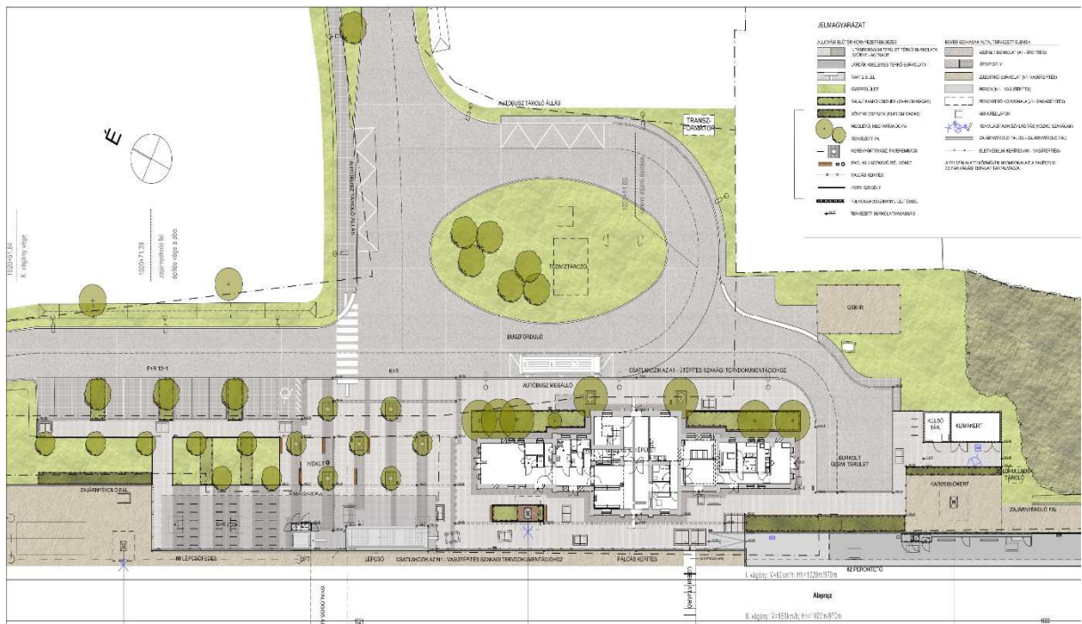
4. ábra Lőkösháza állomási előtér