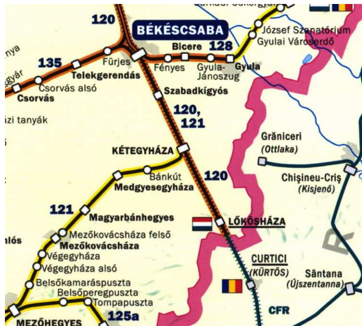
1. ábra 120. sz. vasúti fővonal